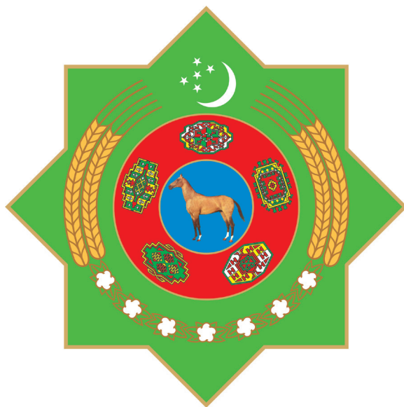
TÜRKMENISTANYŇ DÖWLET TUGRASY