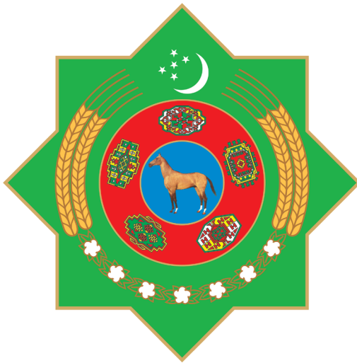
TÜRKMENISTANYŇ DÖWLET TUGRASY