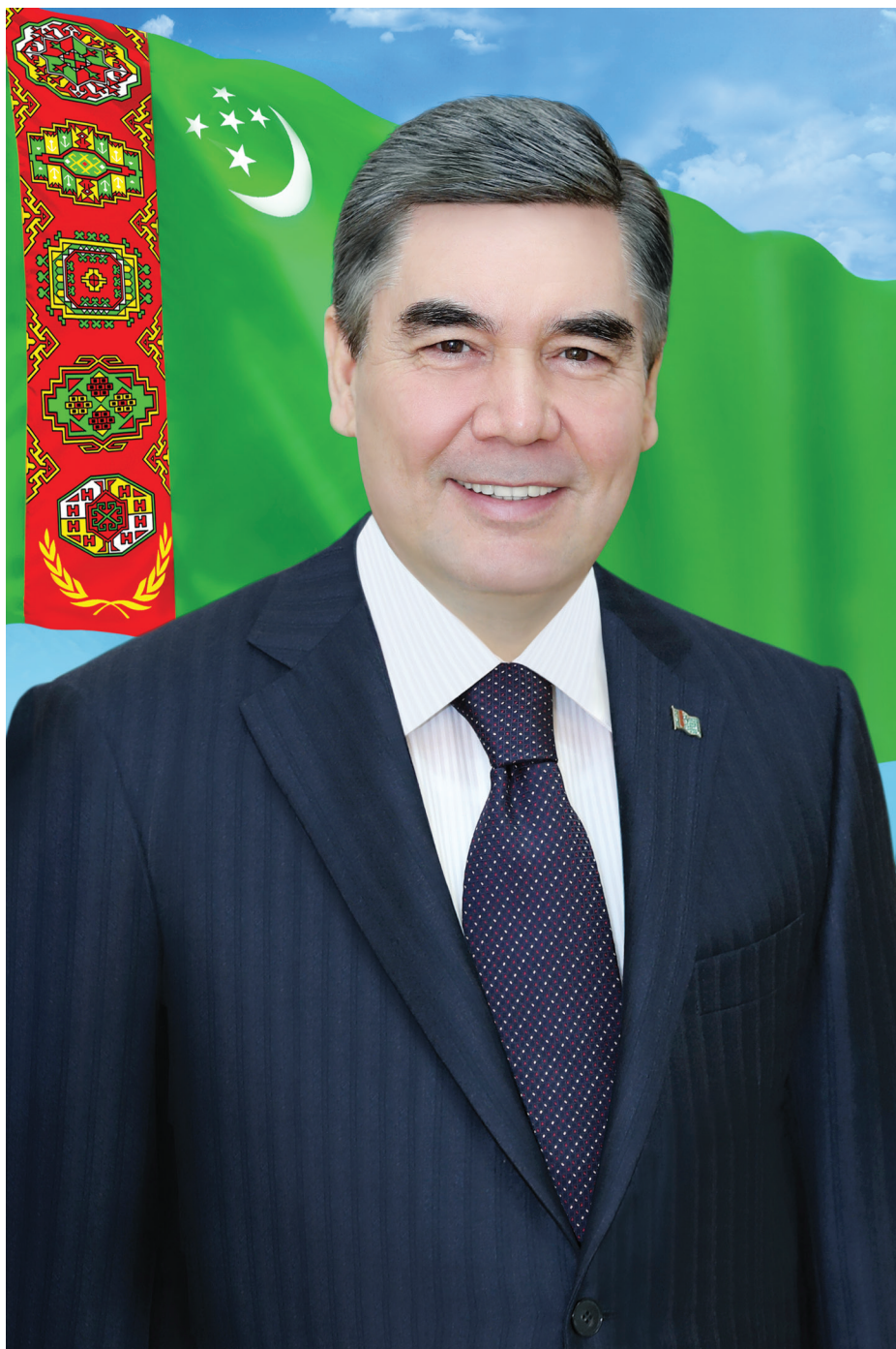
TÜRKMENISTANYŇ PREZIDENTI GURBANGULY BERDIMUHAMEDOW