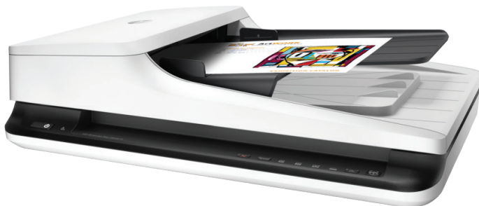
4-nji surat. Nusgalaýjy planšet A4/3 ölçegli

a) nusgalamak we elektron görnüşine geçirmek, surata almak üçin merkezden uzakda (periferiýa) enjam gerek.