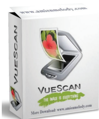
8-nji surat. VueScan (köp hyzmatly enjam üçin)