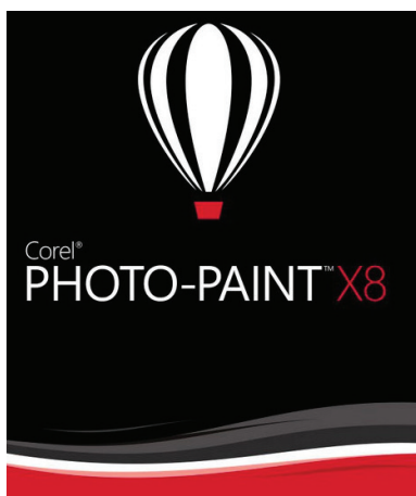
7-nji surat. Corel PHOTO-PAINT (nusgalaýjy planşet A4/A3 ölçegli)