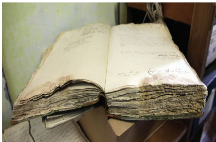
1-nji surat. Kitapda heň kömelekleriniň döremegi

Kömelekleriň ösen ýerlerinde kagyzyň berkligi ýitýär, kitabyň sahypalary gaçýar ( 1-nji surat ). Kömelekleriň käbir görnüşleri kagyzyň ýüzünde sary, mele, gyzyl, gara, goňur reňkli pigment tegmilleri galdirýar. Aýyrmasy örän kyn bolan bu tegmiller kagyzyň görkünü gaçyrýar.