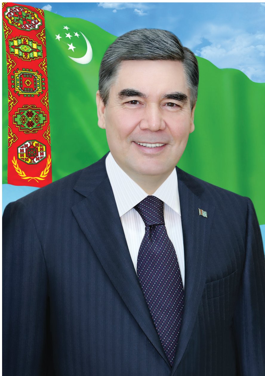
TÜRKMENISTANYŇ PREZIDENTI GURBANGULY BERDIMUHAMEDOW