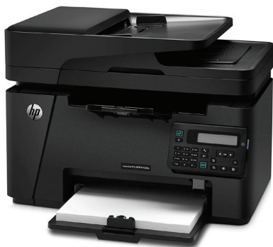
5-nji surat. Köp hyzmatly çap ediji, nusgalaýjy enjam (printer)

b) resminamalary nusgalamak, elektron nusgalaryny işlemek üçin maksatnama üpjünçiligi we enjamlar.