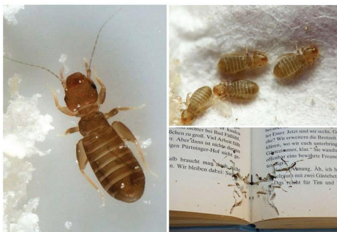
2-nji surat. Arhiw resminamalarynda duş gelyän mör-möjekler

Gadym döwürlerden bäri resminamalar mör-möjeklerden goralydyr. Biziň eýýamymyza çenli papiruslary mör-möjeklerden goramak üçin olara kedr ýagy çalnydyr. Şu maksat bilen resminamalaryň sahypalarynyň arasynda ýiti ysly ösümlikleriň ýapraklary ýa-da gülleri salnyp goýlupdyr. Golýazma saklanylýan tekjelere gorçisa, gara burç, zäk sepilipdir. Derili sahaplar bilen iýmitlenýän tomzaklaryň gurçuklary golýazma sahypalaryna geçmez ýaly, onuň jildine gurşun bölegini goýupdyrlar.