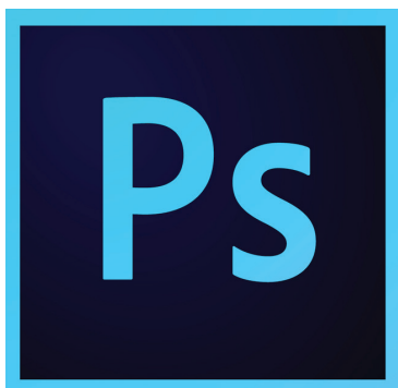
6-njy surat. Adobe Photoshop (nusgalaýjy planşet A4/3 ölçegli)