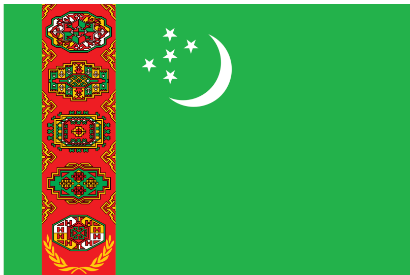
TÜRKMENISTANYŇ DÖWLET BAÝDAGY