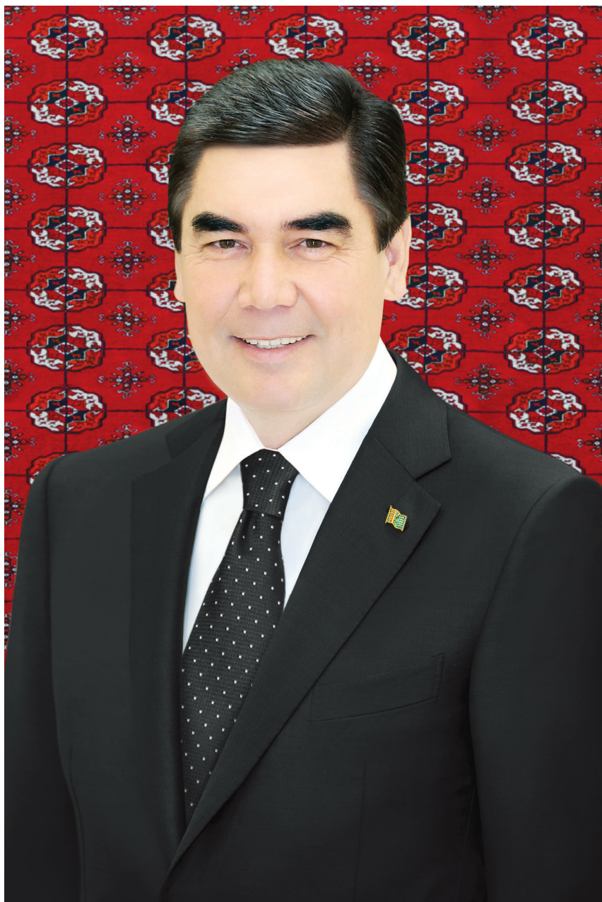
TÜRKMENISTANYŇ PREZIDENTI GURBANGULY BERDIMUHAMEDOW