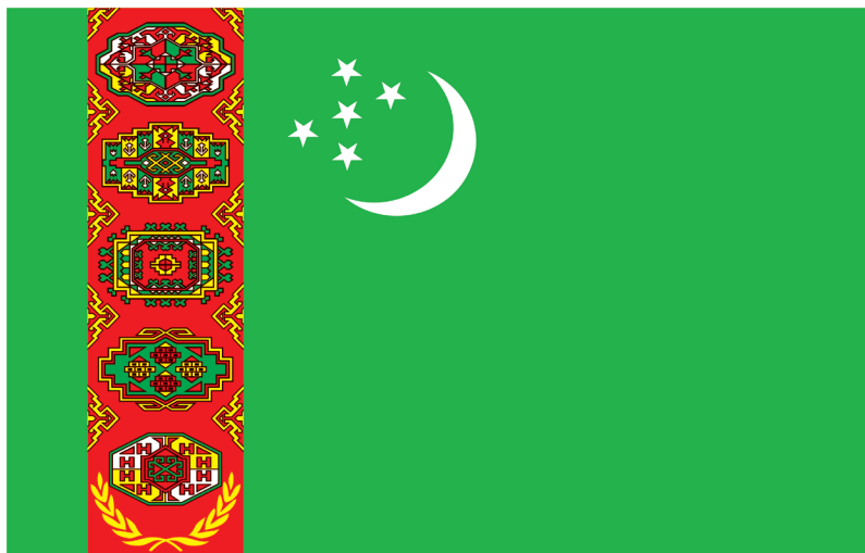
TÜRKMENISTANYŇ DÖWLET BAÝDAGY