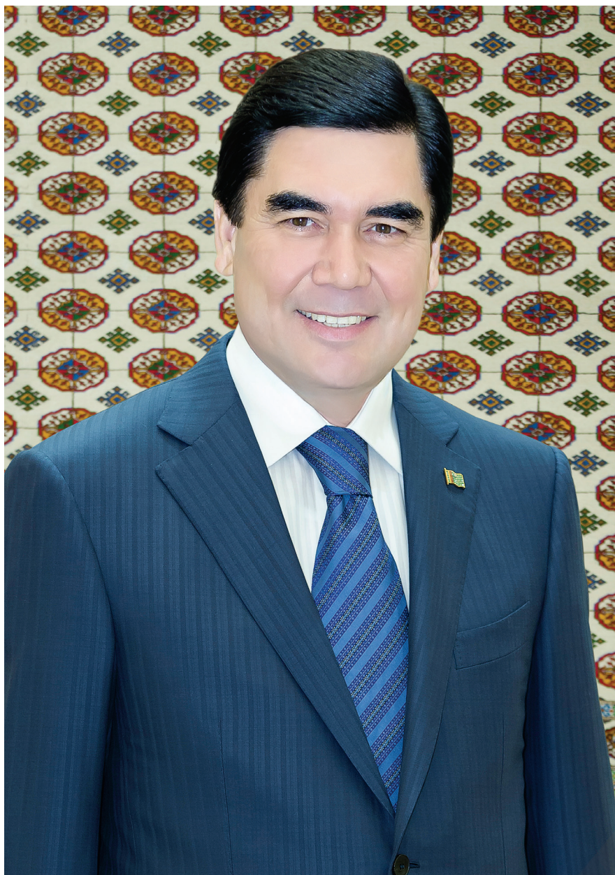
TÜRKMENISTANYŇ PREZIDENTI GURBANGULY BERDIMUHAMEDOW