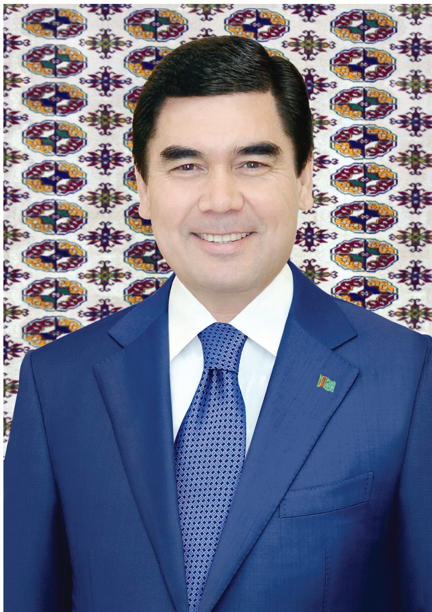
TÜRKMENISTANYŇ PREZIDENTI GURBANGULY BERDIMUHAMEDOW