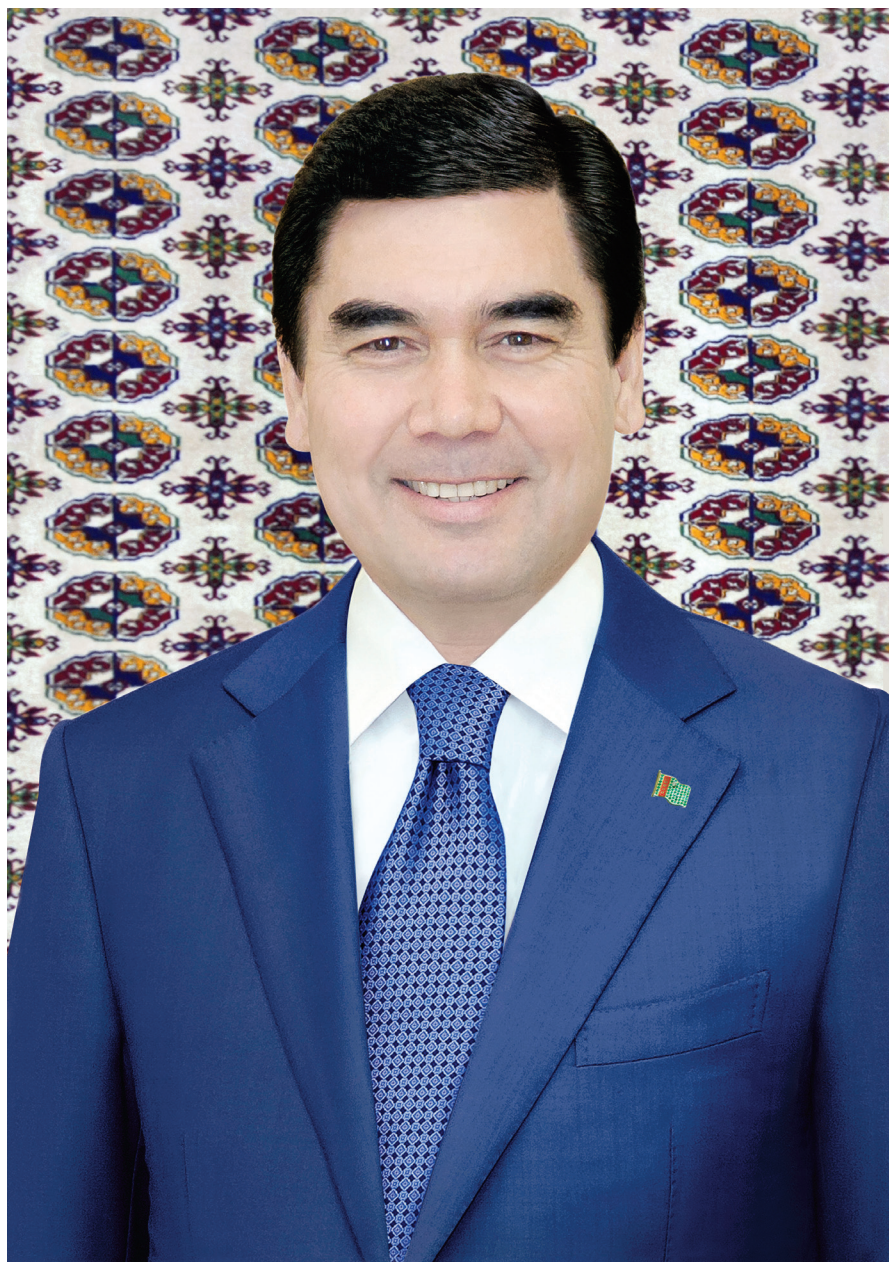
TÜRKMENISTANYŇ PREZIDENTI GURBANGULY BERDIMUHAMEDOW